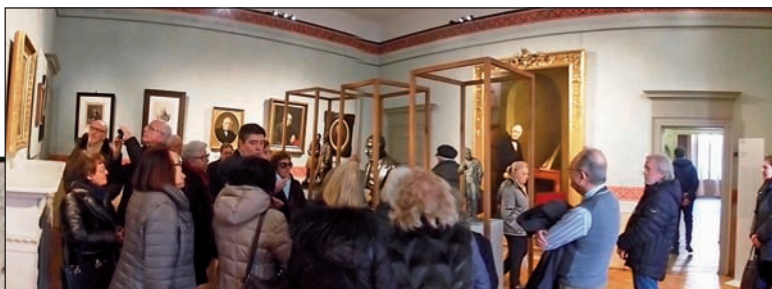
Visita a Casa Manzoni

Continuano le iniziative culturali di 50&Più e 50&Più Università. Dopo l'ottimo esito della visita alla Casa del Manzoni, riprende anche il ciclo pluriennale delle "Lezioni della