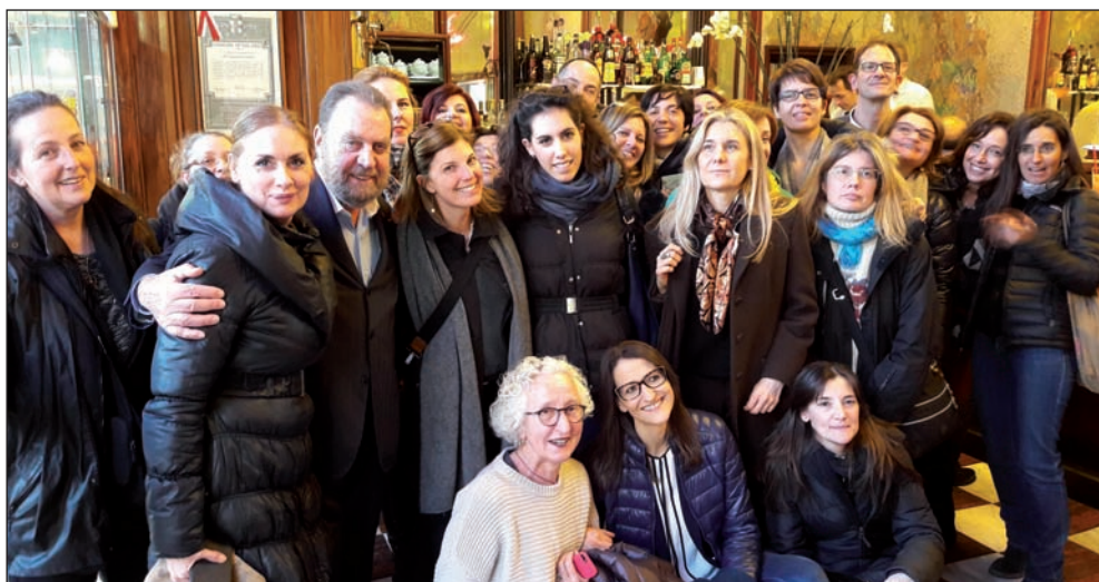
In questa pagina due foto: al Camparino e prima di entrare da Peck